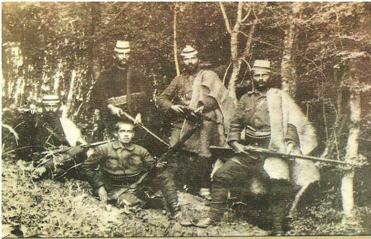
Çeta e Sadik Zharrit në Shpat (1911)