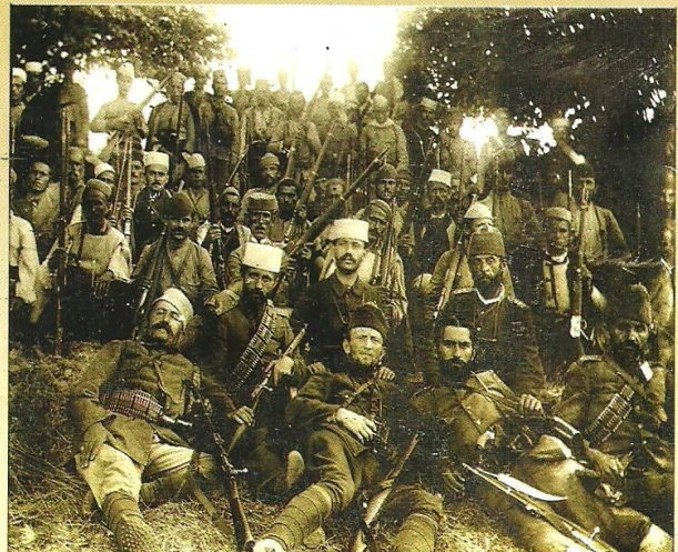
Luftëtarë nga krahina e Elbasanit (1911)